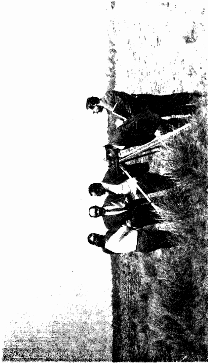
Primo sopralluogo nel « deserto » dove sorgerà il Circolo Baia Verde.